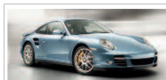
Porsche 911 Turbo S

Um die Idee Turbo auszuschöpfen, darf man ihr keine Grenzen setzen. Effizienz braucht nun mal Leistung. Aufgeladen im neuen Porsche 911 Turbo S.