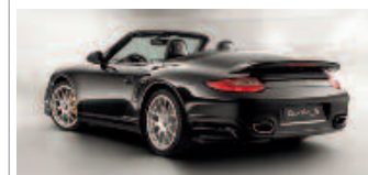
Porsche 911 Turbo S Cabriolet