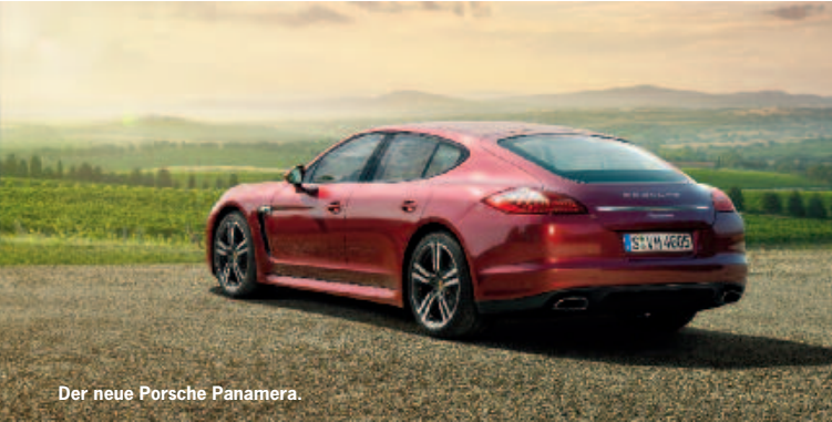
Der neue Porsche Panamera.