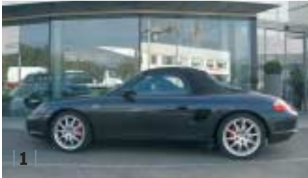
| 1 | Porsche Boxster S (1986) , atlasgrau, 191 kW (260 PS), 3.200 ccm, EZ 09/04, Leder schwarz, 27.000 km

Dieses sportliche Motto gilt auch für den Kauf eines Porsche. Dabei sein und mitfahren ist alles. Vielleicht gehen ja auch Sie bald mit einem unserer topgepflegten Gebrauchtwagen an den Start.