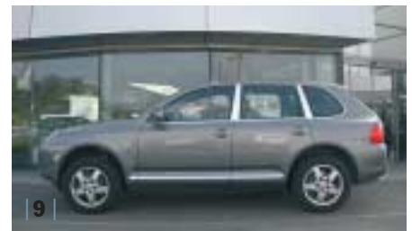
| 9 | Porsche Cayenne S , titangrau, 250 kW (340 PS), 4.500 ccm, EZ 01/05, Leder steingrau, 43.900 km