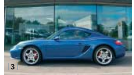
| 3 | Porsche Cayman S , cobaltblau, 217 kW (295 PS), 3.387 ccm, EZ 11/05, Leder steingrau, 23.650 km