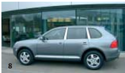
| 8 | Porsche Cayenne , titan, 184 kW (250 PS), 3.200 ccm, EZ 03/06, Leder schwarz, 18.000 km