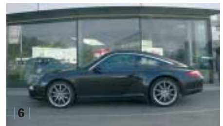
| 6 | Porsche 911 Targa 4 (1997) , basalt-schwarz, 239 kW (325 PS), 3.596 ccm, EZ 08/07, Leder schwarz, 3.500 km