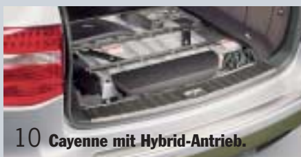
10 Cayenne mit Hybrid-Antrieb.

Große Auswahl an jungen Cayenne Gebrauchtwagen vorrätig.