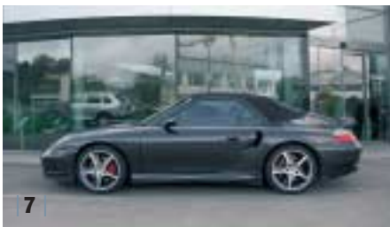
| 7 | Porsche 911 Turbo Cabrio (1996) , atlasgrau, 309 kW (420 PS), 3.600 ccm, EZ 03/04, Naturleder dunkelgrau, 39.800 km