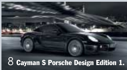
8 Cayman S Porsche Design Edition 1.