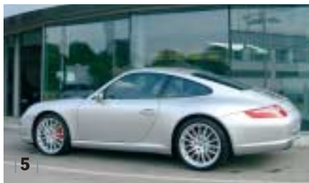
| 5 | Porsche 911 Carrera S (1997) , arktis-silber, 261 kW (355 PS), 3.824 ccm, EZ 05/07, Naturleder dunkelgrau, 5.000 km