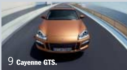
9 Cayenne GTS.