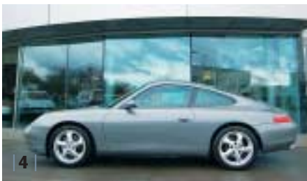
| 4 | Porsche 911 Carrera Coupé (1996) , sealgrau, 221 kW (300 PS), 3.600 ccm, EZ 03/01, Leder schwarz, 83.700 km