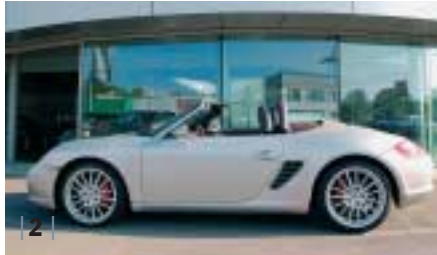
| 2 | Porsche Boxster S (1987) , arktis-silber, 206 kW (280 PS), 3.200 ccm, EZ 12/05, Leder cocoa, 19.900 km