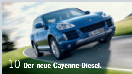
10 Der neue Cayenne Diesel.