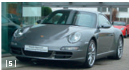
| 5 | Porsche 911 Carrera 4S (997) , meteorgraumetallic, 261 kW (355 PS), 3.800 ccm, EZ: 03/07, Volleder schwarz, 28.000 km Euro 79.700,-*