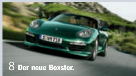
8 Der neue Boxster.