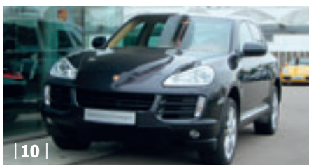
| 10 | Porsche Cayenne S , basaltschwarzmetallic, 283 kW (385 PS), 4.806 ccm, EZ: 11/07, Volleder havanna/sandbeige, 12.500 km Euro 69.900,-*