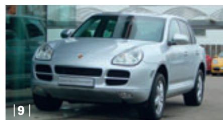
| 9 | Porsche Cayenne S , kristallsilbermetallic, 250 kW (340 PS), 4.500 ccm, EZ: 08/07, Volleder schwarz, 22.500 km Euro 54.900,-*