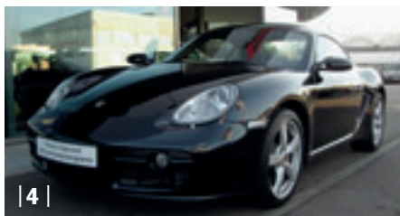
| 4 | Porsche Cayman , basaltschwarzmetallic, 180 kW (245 PS), 2.700 ccm, EZ: 04/08, Teilleder schwarz, 6.500 km Euro 45.900,-*