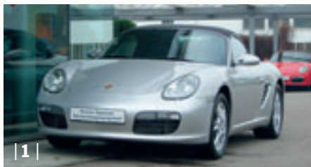
| 1 | Porsche Boxster (987) , 2,7 l, arktis-silbermetallic, 176 kW (239 PS), 2.700 ccm, EZ: 05/05, Leder steingrau, 17.500 km Euro 35.700,-

Sie träumen schon lange von einem Porsche? Sportlich, schön und nicht unbedingt ganz neu? Für sich ganz allein oder als exklusives Geschenk?