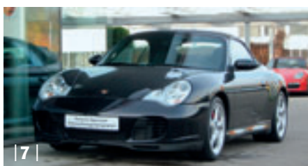
| 7 | Porsche 911 Carrera 4S Cabriolet (996) , basaltschwarzmetallic, 235 kW (320 PS), 3.600 ccm, EZ: 01/05, Leder schwarz, 69.350 km Euro 63.900,-*