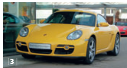
| 3 | Porsche Cayman , speedgelb, 180 kW (245 PS), 2.700 ccm, EZ: 04/08, Teilleder schwarz, 14.000 km Euro 43.700,-*