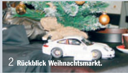
2 Rückblick Weihnachtsmarkt.

Die Accessoires der Porsche Design Driver's Selection.