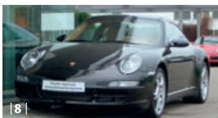
| 8 | Porsche 911 Targa 4 (997) , schwarz, 239 kW (325 PS), 3.600 ccm, EZ: 11/06, Leder sandbeige, 29.800 km Euro 78.900,-*