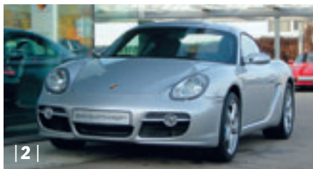
| 2 | Porsche Cayman , 2,7 l, arktis-silbermetallic, 180 kW (245 PS), 2.700 ccm, EZ: 06/07, Leder schwarz, 11.700 km Euro 44.800,-