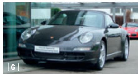
| 6 | Porsche 911 Carrera 4 Cabriolet (997) , basaltschwarzmetallic, 239 kW (325 PS), 3.600 ccm, EZ: 04/06, Volleder cocoa, 18.000 km Euro 83.900,-*