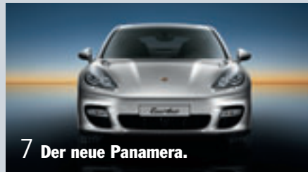
7 Der neue Panamera.