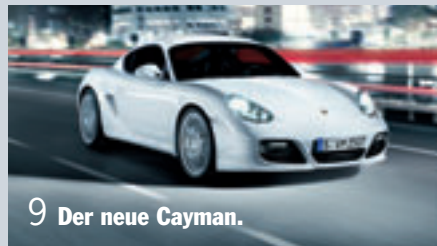
9 Der neue Cayman.